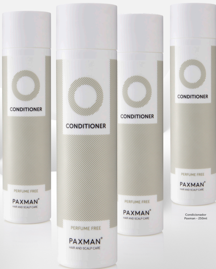
Condicionador Paxman - 250ml

O Condicionador Paxman Hair and Scalp Care foi especialmente formulado para pessoas em tratamento quimioterápico. Com ingredientes suaves que protegem os cabelos e o couro cabeludo, o Condicionador Paxman é dermatologicamente testado e suave para peles sensíveis ou alergias. Nosso condicionador representa o mais recente desenvolvimento em cuidados com os cabelos e tratamento do couro cabeludo.